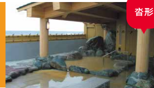
利尻町ふれあい温泉

空気に触れると茶褐色に変化する泉質は、「金の湯」と呼ばれています。露天風呂から望む日本海の夕陽や満天の星空が人気です。