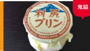
利尻プリン/長生堂寺嶋菓子舗

5代目店主がつくるメープルなど3種類の優しい味のプリンのほか、マカロン生地の「利尻島」や利尻最中など、サイクリングのお供に最適です。