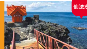
北のいつくしま弁天堂

海に向かって突き出た「龍神の岩」の上に建てられており、海の青と鳥居と祠の赤のコントラストが美しい光景を作り出しています。