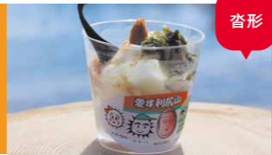
愛す利尻山/北利ん道

利尻昆布を混ぜたアイスクリームに、乾燥ウニと昆布の塩を乗せ、昆布のスポンでいただきます。ここでしか食べられない貴重なご当地アイスです。