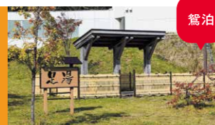
利尻富士温泉(足湯)

利尻島では、お店によってトッピングなどが異なる、オリジナリティ溢れる島グルメです。海鮮が効いたスープも絶品!