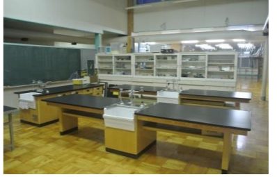
■図画工作スペース