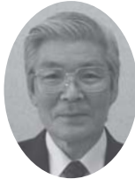
副議長就任あいさつ

議会は執行機関が適法・適正かつ公平になされているかどうか町政を監視し、またしっかりとした意見・見識を持って、町民の付託に答えなければなりません。利尻富士町民がこの町に住んでよかったと思えるまちづくりの為に、町民の皆様方の声に耳を傾け、健全で活力ある議会を目指してまいりますので、町民の皆様方のご支援・ご協力をお願い申し上げます。ご挨拶と致します。