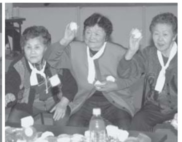
高齢者スポーツ大会 「おじいちゃん・おばあちゃんとのゲームで大盛り上がりの子供たち!!」