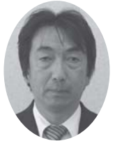
議長就任あいさつ