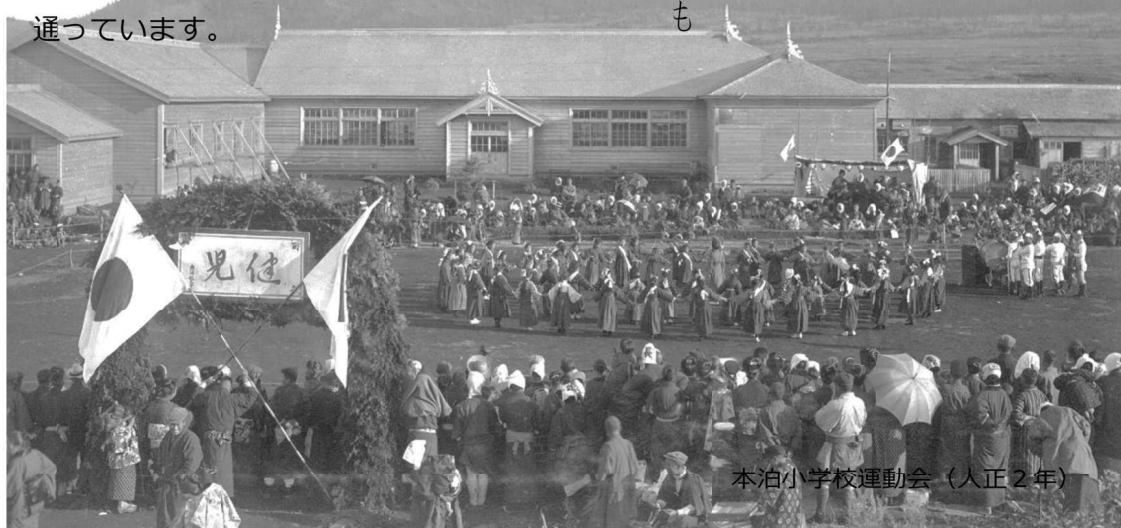
本泊小学校運動会（入正2年）

島学潮北日 のぼぎのざ 子ういはい かみひてに しんびなく こなくいく くが 育窓本か ついあ泊が たのてや め日いて も