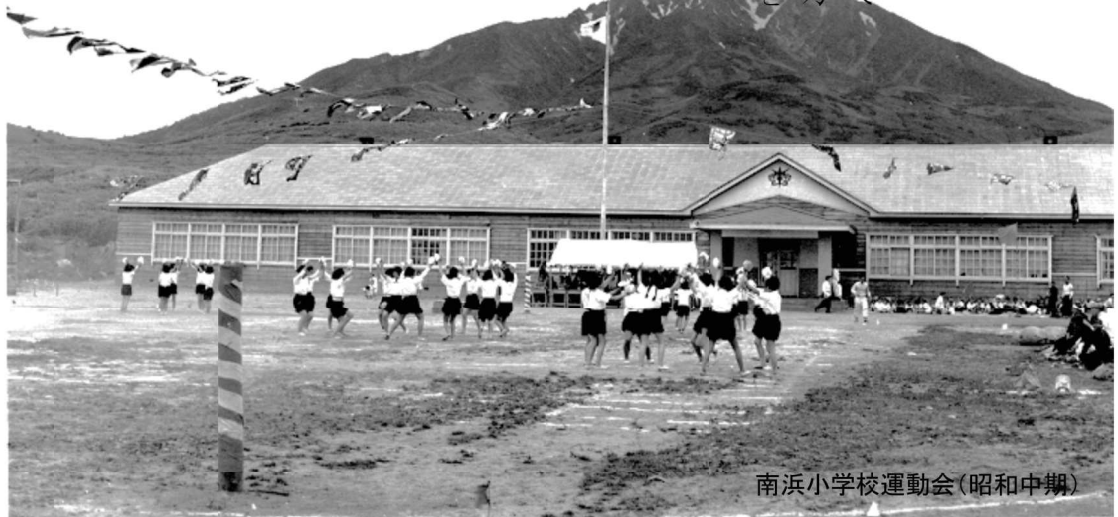
南浜小学校運動会（昭和中期）