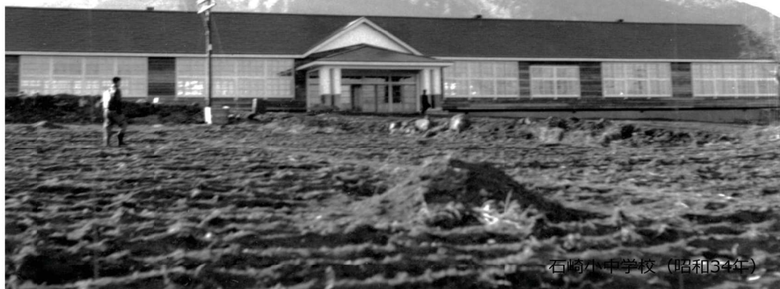
石崎小中学校（昭和34年）

石崎小学校校歌（昭和39年） この学そ青空 のぶよくも 石よか朝岬 崎正ぜ風も のし通ぐ 学校くうか でい窓のや つあいろ のけて の日て も