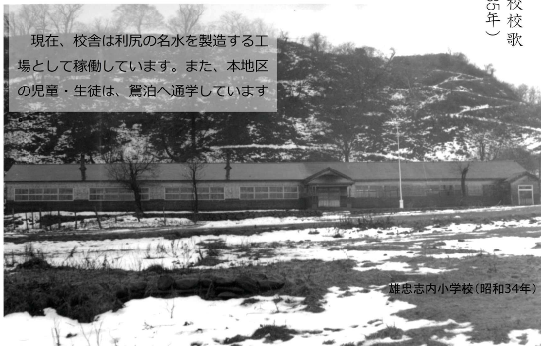
雄忠志内小学校(昭和34年)