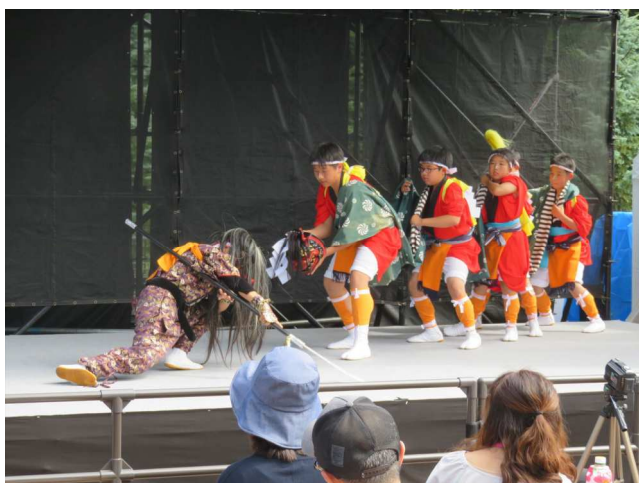
ほっかいどう子ども民俗芸能振興事業全道大会 (南浜獅子神楽子ども教室)