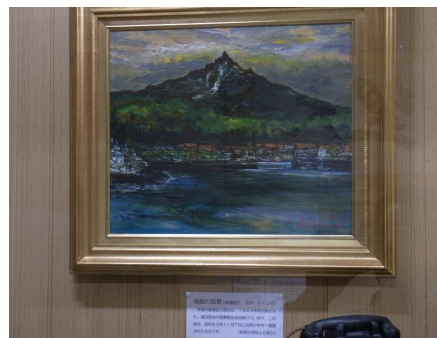
高橋益之「鬼脇風景」