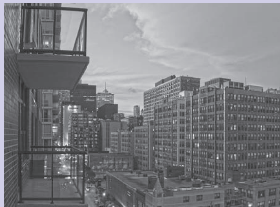
『シカゴの黄昏』

To all the students, teachers, coworkers, friends, and everyone I met during my time in Japan, thank you for everything. I am looking forward to the day we can meet again.