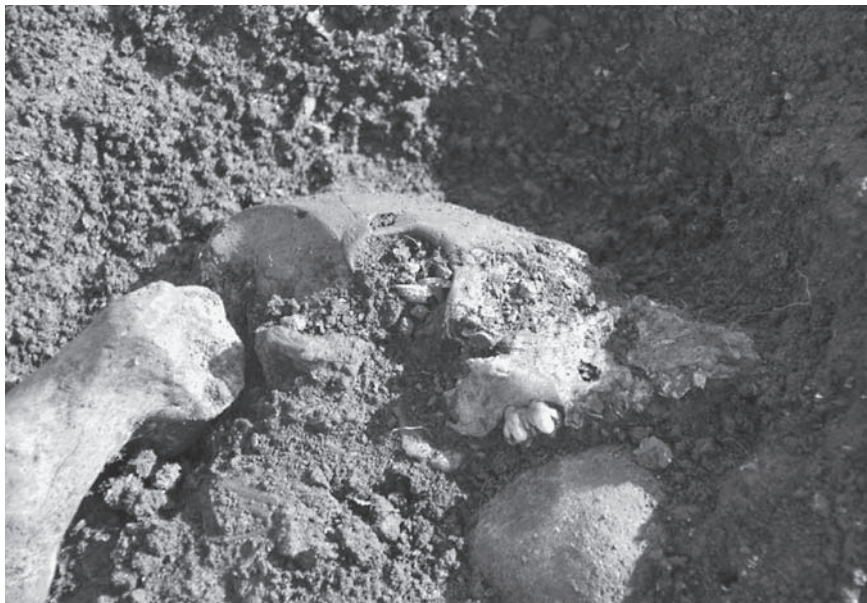
カラフトブタの頭骨（利尻富士町役場遺跡出土）

つまり、古代におけるブタを飼育する風習は、アムール河流域の靺鞨からサハリンの流鬼をへて、道北を中心としたオホーツク文化に伝わったということになります。しかしながら、なぜ利尻・礼文を中心に、ブタ飼育が根付いたのか、その理由は定かではありません。離島ならではのヒグマやシカが生息しない安定した飼育環境や不漁時の非常的な食糧、あるいは流鬼のような衣服利用などいくつか理由がありそうです。