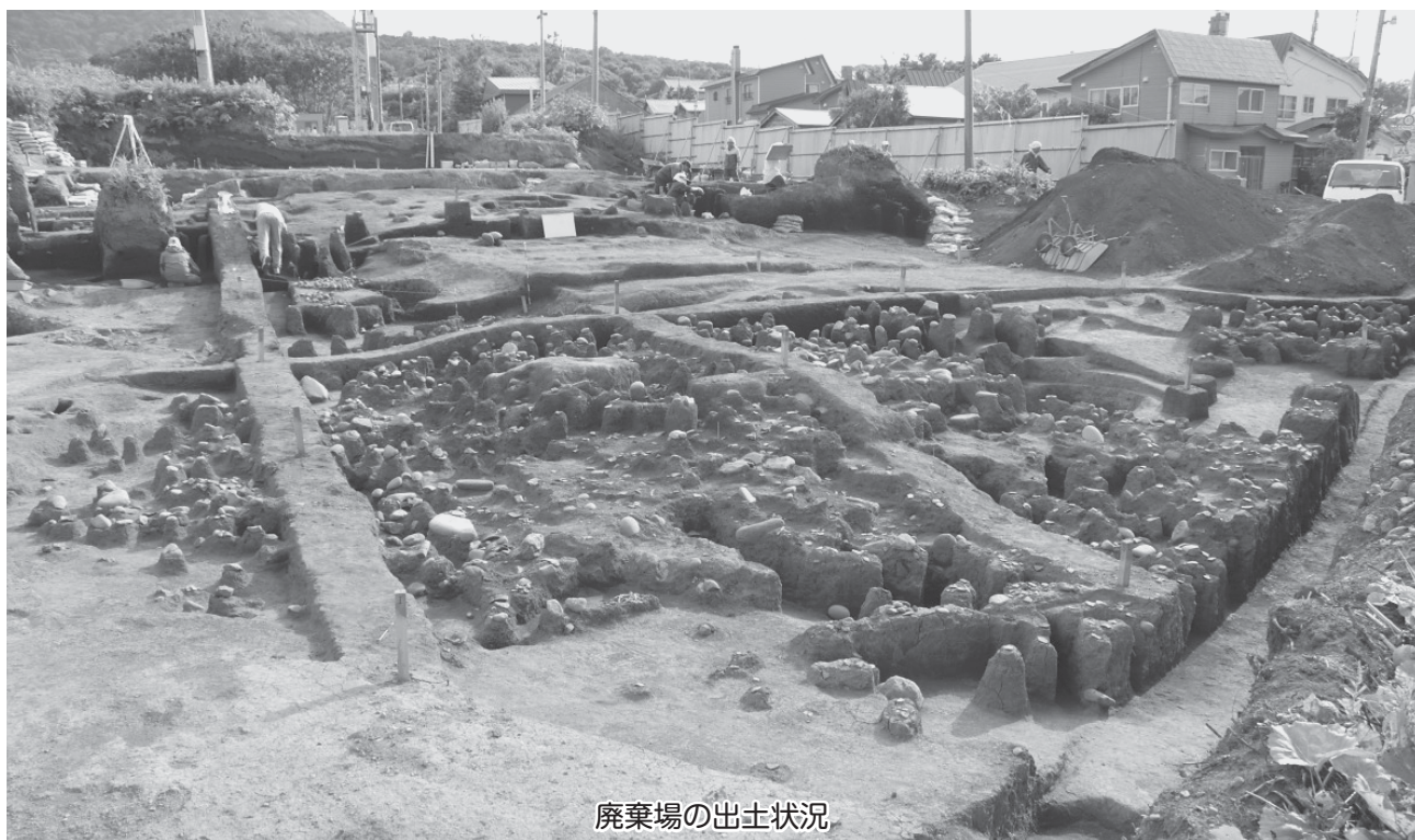
廃棄場の出土状況

現在は、出土品の整理作業中です。ある程度まとまりましたら、成果報告会として町民のみなさんに公開する予定です。