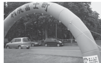
エアゲート 1式 高さ3m×間口5m