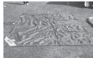
テントインナーマットレス 7枚 295×295cm