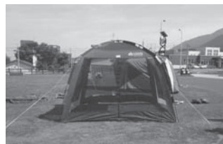
UVクイックスクリーン 5張 300×270×210cm