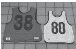
メッシュベスト ジュニア用 52×45cm 120着 大人用 59×55cm 100着