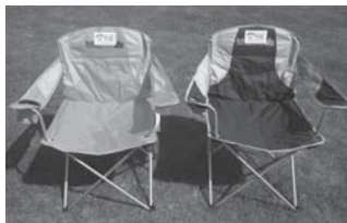
ミディアムチェア 42脚 60×40×68cm