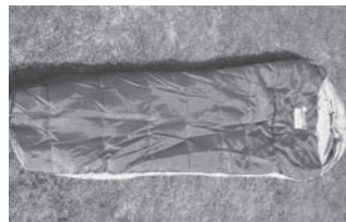
アリーバ6(寝袋) 42枚 80×210cm