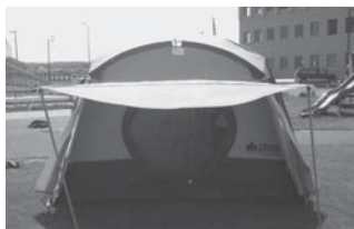
クイックドーム(テント) 7張 300×480×195cm