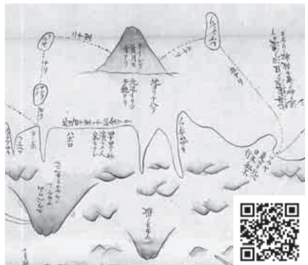
リイシリ(「蝦夷国全図」部分、国立国会図書館所蔵) *QRコードを読み取ると、全体図が閲覧できます

さらに、発掘調査によって種屯内遺跡 たねとんない (利尻町種富町)や礼文島重兵衛沢遺跡・浜中2遺跡 じゅうへえさわ から、当時のアワビ貝塚が見つかっています。アワビの採取や加工には、アイヌが従事していました。出土する貝殻のサイズは、商品価値のある殻長10cm前後が多く、なかでも殻に1～3個の四角い穴が開いているものは、鉄製のヤスで突く漁法で採取されていたことがわかっています。