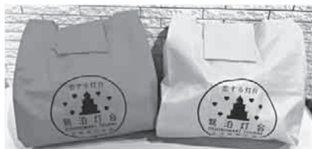
恋する灯台-鷺泊灯台エコバック