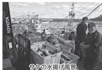
サケの水揚げ風景

減産となった天然昆布ですが、新型コロナウイルスの影響により下落していた単価については回復傾向にあり、鷺泊・鬼脇両地区で行われているチェーン振り等の磯焼け対策の効果に期待がもたれています。