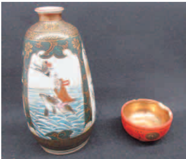
四方徳利と金彩盃

石川県が産地の九谷焼はその代表例であり、細密な図柄が特徴的で高級感を漂わせています。郷土資料館には、 しほう とつくり 四方徳利と きんさい さかすき 金彩の盃のほか、旭浜の瀧澤漁場で使われていた茶碗や湯のみが展示されており、北前船による物流の一端が垣間見えます。